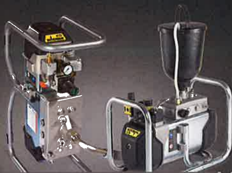
高圧ダイアフラムポンプ