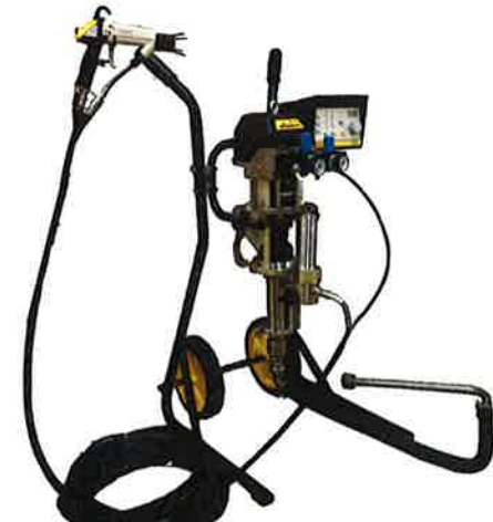
エアーコート静電 P28-40EAC 標準セット