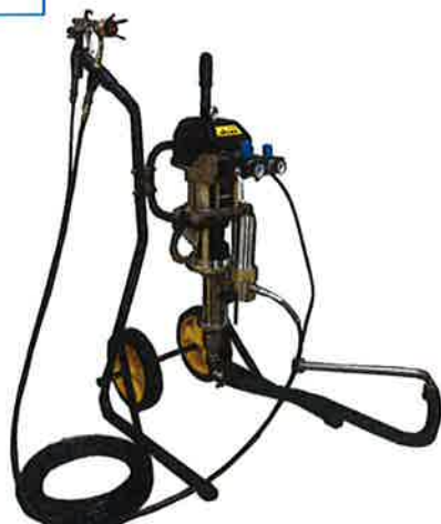
ミストレスコーター P28-40AC 標準セット