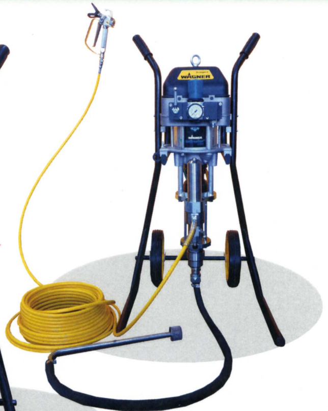
レオパード 35-70 標準セット